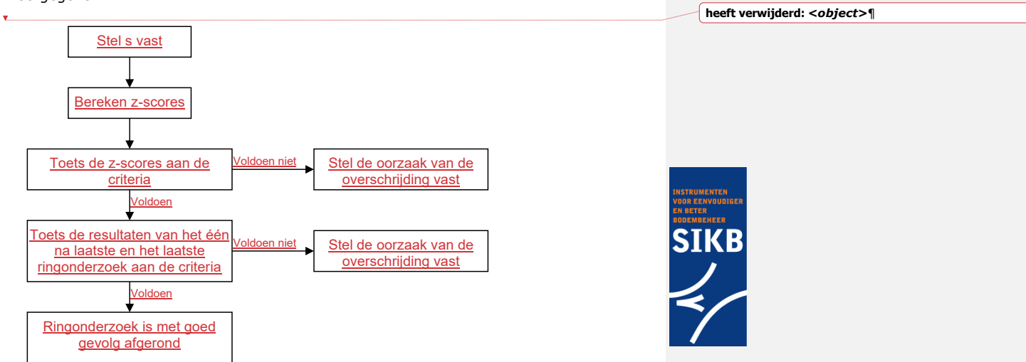
Figuur 1 Stappenschema toetsing ringonderzoek resultaten

In het volgende processchema is het een en ander ter verduidelijking grafisch weergegeven.